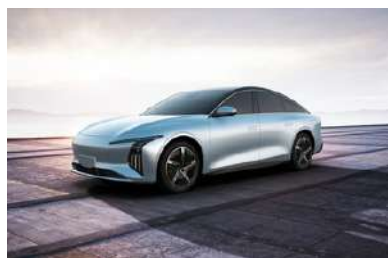
Svetlo modra kovinska