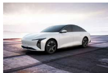
Bela (črna streha)